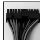
Placa madre con 24 clavijas